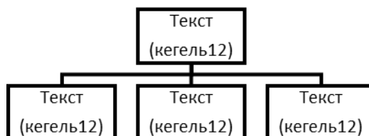
Рисунок 1. Название рисунка

(Times New Roman, размер шрифта 12, строчные буквы, выравнивание по центру, одинарный интервал, обычный шрифт, рисунок выполняется в черно-белом формате, ссылка на источник информации)